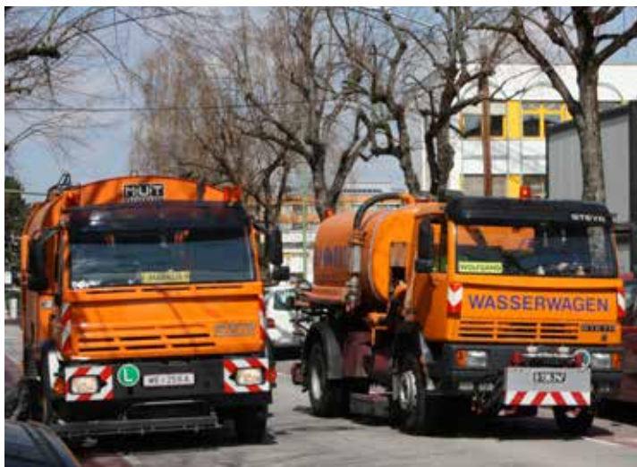
Die Entfernung des Rollsplitts von den öffentlichen Verkehrswegen mit Kehrmaschinen sowie zwei Wasserwägen ist in vollem Gange.

Auch der Materialeinsatz ist im Vergleich zum Vorjahr gestiegen: Im heurigen Winter wurden insgesamt 1164 Tonnen Salz und 541 Tonnen Rollsplitt verbraucht, 2015/2016 waren rund 540 Ton-