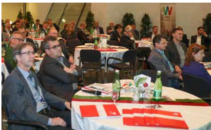
Mehr als 70 Gäste aus dem ganzen Land nahmen am Oberösterreichischen Städtetag in den Minoriten teil.

gemeinsamen Abendessen, um sich über die Tagungsinhalte und andere kommunale Themen auszutauschen und sich zu vernetzen.