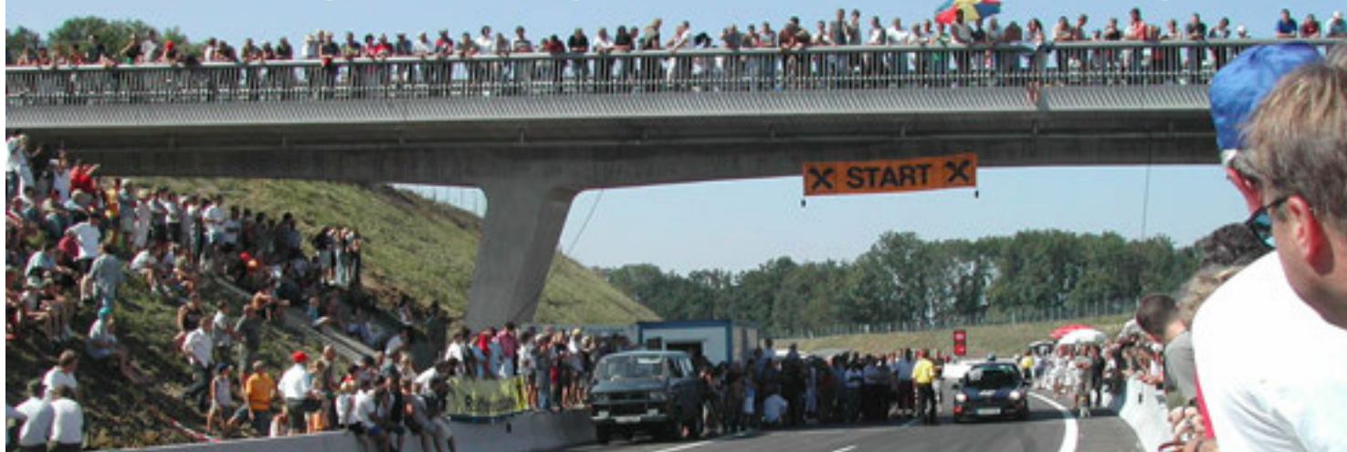
Zur Verkehrsfreigabe des Südteils der Welser Westspange gab es am Sonntag, 24. August 2003 ein großes Volksfest auf der neuen Autobahn.

Vom Knoten Wels bis Wels-West ist die A8 Innkreis Autobahn bereits seit 1987 fertig. In diesem nördlichen Teil liegt auch die neue Anschlussstelle Wels Wirtschaftspark. Der südliche Teil der Westspange bis zum Voralpenkreuz war hingegen lange heftig umstritten und ging daher erst 2003 in Betrieb.