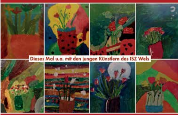
Dieses Mal u.a. mit den jungen Künstlern des ISZ Wels

MI / 28.06. / 19:00 / Welser Kulturmeile / Wels