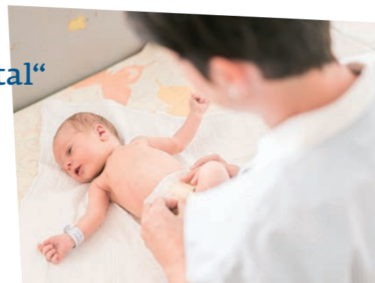
Eine Einrichtung der Kreuzschwestern und Franziskanerinnen