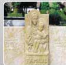
mit Finalit behandelt

Finalit Komplett-Steinpflege GmbH | Friedhofstr. 67 | 4600 Wels | Tel.: 07242/688 71 | Fax: 07242/677 71-17 | office.wels@finalit.com | www.finalit.com