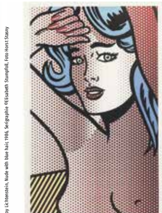
Roy Lichtenstein, Nude with blue hair, 1966, Serigraphie et Elisabeth Stumpfoll

AUSSTELLUNGSERÖFFNUNG Unter dem Titel „INSPIRATION KÖRPER“ wird im Obergeschoss des Museum Angerlehner eine französische, unveröffentlichte Privatsammlung von Druckgrafiken der bedeutendsten Künstler:innen des 20. Jahrhunderts gezeigt. Wie ein roter Faden zieht sich die Darstellung des Körpers durch die Werke und beleuchtet die Inspiration des Künstlers / der Künstlerin durch seine Muse. Mit Lithografien, Radierungen, Siebdrucken und Fotografien kann der Ausdruck des Körpers im Wandel der Zeit und die Entwicklung der menschlichen Identität in der Kunst auf eindrucksvolle Art und Weise beobachtet werden. Der