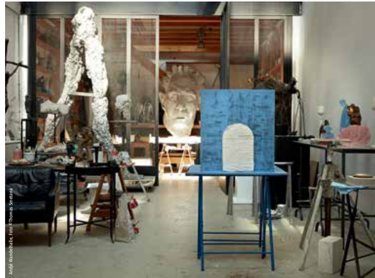
Andrzej Pietrzyk

SO / 05.11. / 15:00 / Museum Angerlehner / Thalheim bei Wels