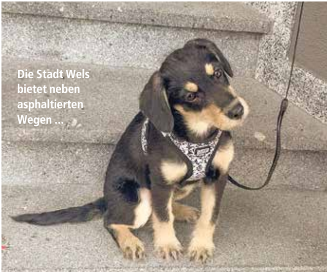
Die Stadt Wels bietet neben asphaltierten Wegen ...