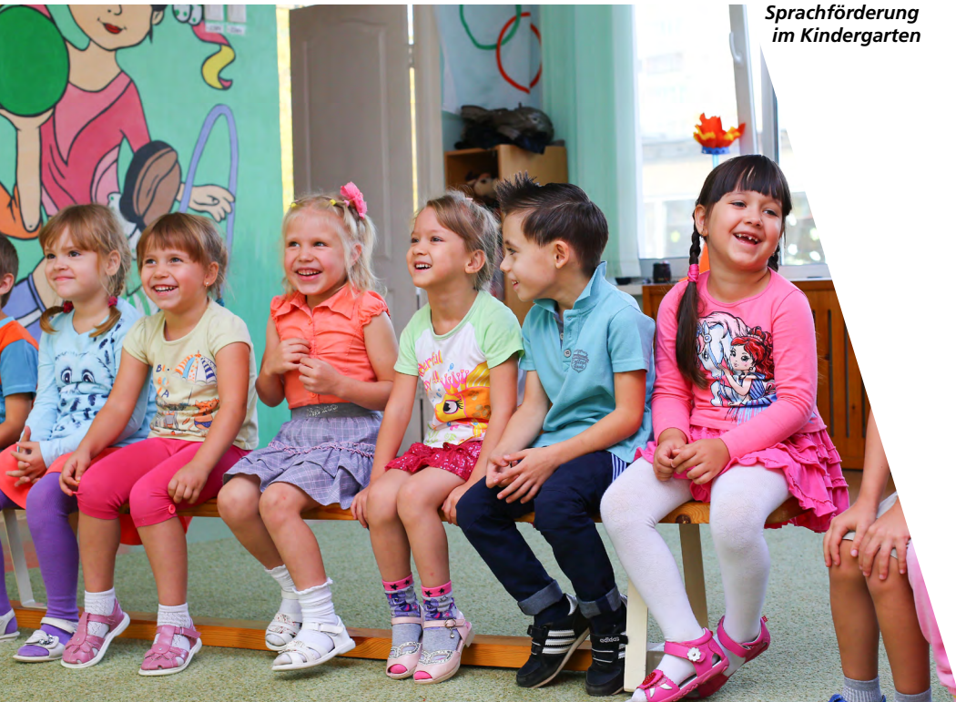
Sprachförderung im Kindergarten

Das ist ein niederschwelliges Angebot in Kooperation mit der Volkshilfe zum Üben der deutschen Sprache, besonders zur Verständigung in Situationen im Alltag. KoKo findet meist am Vormittag statt.