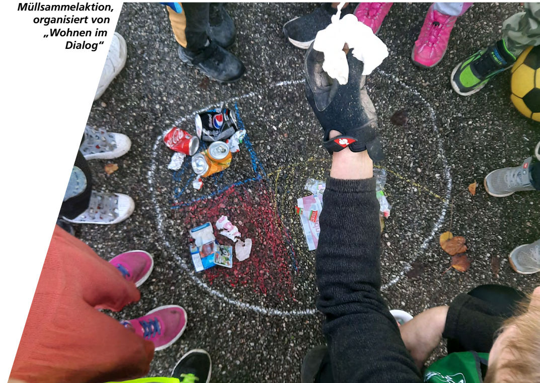
Müllsammelaktion, organisiert von „Wohnen im Dialog“