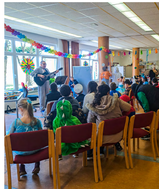
Faschingsfest im Quartier Gartenstadt