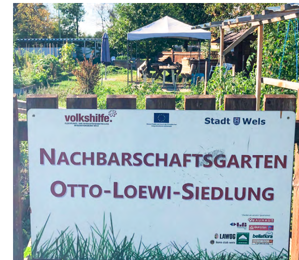
Nachbarschaftsgarten in der Otto-Loewi-Siedlung

Im Siedlungsgebiet der Otto-Loewi-Straße gibt es für die Bewohner einen Nachbarschaftsgarten. Rund zehn Hobbygärtner kümmern sich selbstständig um ihre Beete und pflanzen Gemüse, Obst und Blumen an.