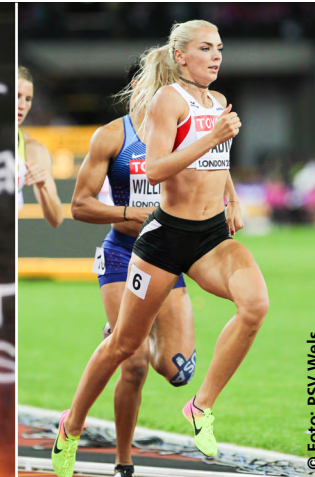
Weltklasse-Leichtathletin aus Wels: Ivona Dadic.