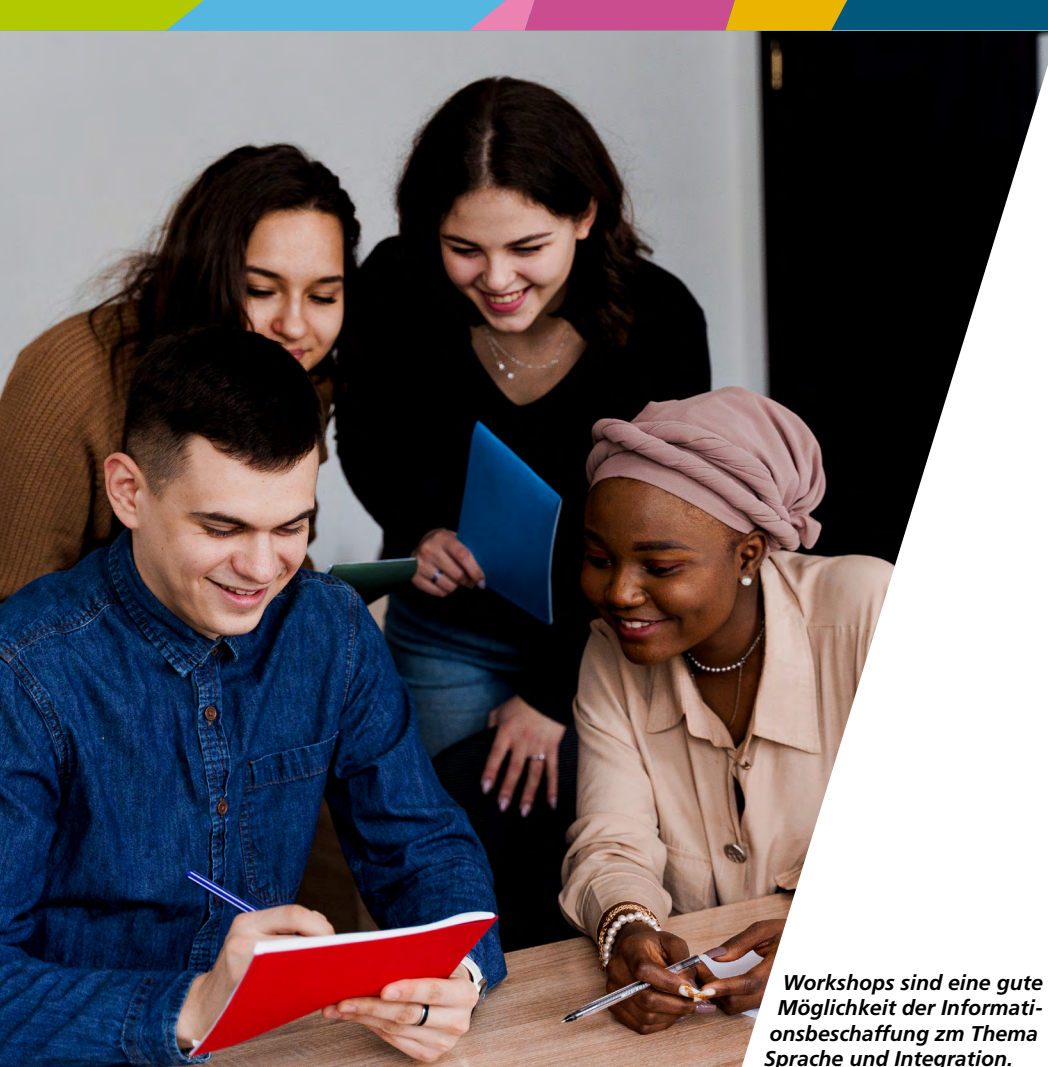
Workshops sind eine gute Möglichkeit der Informationsbeschaffung zum Thema Sprache und Integration.