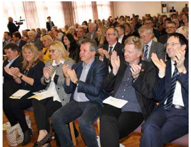
Bis auf den letzten Platz gefüllt waren die Räumlichkeiten in der VHS Noitzmühle bei der Eröffnungsfeier.

MAYER SPIRITUOSEN GMBH MEHR ALS WEIN & SPIRITUOSEN.