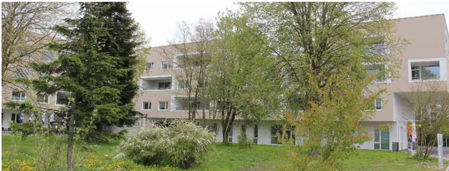
Das neu errichtete Haus Noitzmühle besticht durch seine moderne Architektur und die Lage mitten im Grünen.