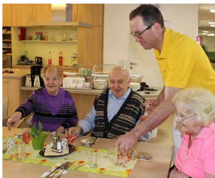
Die Hausgemeinschaften bilden ein Zuhause voller Normalität und Herzlichkeit.

Das nächste Amtsblatt erscheint am Montag, 27. Juni 2016