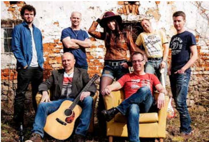
Nähere Infos zu den nun zehn Jahre jungen Hauptdarstellern des Abends gibt es unter www.hoampspue.at im Internet.

Stattfinden wird die Veranstaltung in einer einzigartigen Kulisse vor der Welser Stadthalle (bei Schlechtwetter in derselben). Auf dem Programm steht wie von „Hoampspü“ gewohnt echter Austropop von Austria 3, Rainhard Fendrich, Georg Danzer, Wolfgang Ambros, STS, Falco, EAV, Kurt Ostbahn, Wilfried, Peter Cornelius und Udo Jürgens. Aber auch neuere Klassiker etwa aus dem Salzkammergut von Hubert von Goisern oder den Ausseer Hardbradlern werden an diesem denkwürdigen Abend nicht zu kurz kommen.