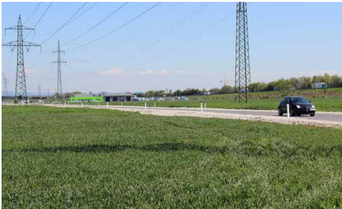
Fast alle Flächen im Gewerbegebiet Oberthan konnten bereits durch die WBA verwertet werden.

Die geografische und topografische Lage der Stadt Wels sowie die vorhandene soziale und technische Infrastruktur sind für Betriebsansiedlungen und die weitere Entwicklung des Standortes ideal. In Zeiten von verstärktem Wettbewerb und zunehmender Vernetzung von Unternehmen ist die Ansiedlung von Unternehmen und Zulieferbetrieben entlang der Wertschöpfungskette (gepaart mit dem Potenzial des Standortes hinsichtlich Forschung und Entwicklung sowie Innovation) eine Chance für mehr regionale Wertschöpfung und Verdichtung. Neue Arbeitsformen wie Shared-