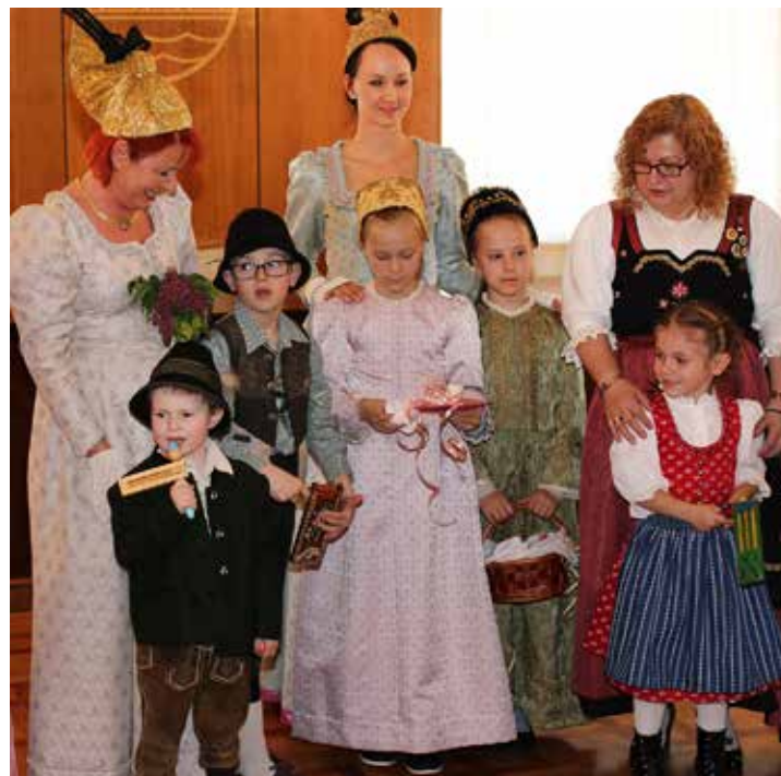
Das Projekt der HAK 2 soll die vielfältige Arbeit der Brauchtumsvereine mehr als bisher vor den Vorhang holen. Im Bild der traditionelle Ostergruß des Brauchtumszentrums Herminenhof am Gründonnerstag.

comer-Nachmittag, Modernisierung der Vereinsaktivitäten, gemeinsame Ausflüge und soziale Aktionen sowie Verbesserung der internen Kommunikation. Auch ein einheitliches Logo für die Welser Brauchtumsvereine wurde entworfen.