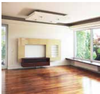
Wels Großzügiges Penthouse

Sprechtage: Montag bis Freitag 08:00 bis 12:00 Uhr Termine nach telefonischer Vereinbarung