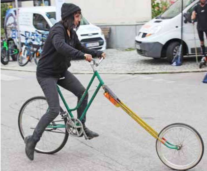
Viele Besucher nutzten die Möglichkeit für eine Probefahrt. Unter den Gefährten befanden sich auch zahlreiche Kuriositäten.