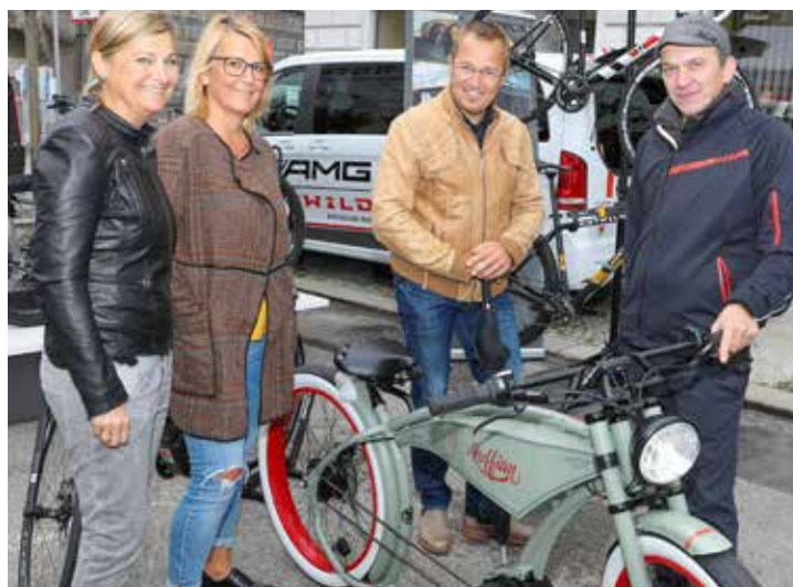
Egal ob mit zwei oder vier Rädern: Die Auswahl an umweltfreundlichen Fortbewegungsmitteln war auch heuer groß.

In die Verlängerung ging die Europäische Mobilitätswoche in Wels am Sonntag, 17. September mit dem Film „ Molière auf dem Fahrrad “ im Medienkulturhaus und dann bis Freitag, 22. September mit diversen Aktionen von Welser Volksschulen .