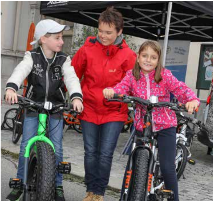
Bewusstseinsbildung ist schon in jungen Jahren wichtig: Der Mobilitätstag ist für sein umfangreiches Kinderprogramm bekannt.