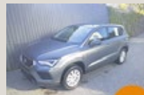
SEAT Ateca Reference Edition EZ 02/2025, 201 km, 115 PS/85 KW, Winterpaket, 5 Jahre/100.000 km Garantie, statt EUR 25.147,- nur EUR 24.345,-*