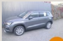
SEAT Ateca Style Edition 1.5 EZ 02/2025, 201 km, 150 PS/110 KW, SEAT TopCard, Keyless, 5 Jahre Garantie statt EUR 37.220,- nur EUR 34.875,-*