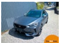
CUPRA Formentor TRIBE VZ e- EZ 11/2023, 29500 km, 150 PS/110 KW, „CUPRA TopCard“ - 12 Monate gültig, 5 Jahre / 100.000 km Garantie, statt EUR 51.214,-