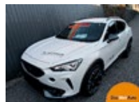
CUPRA Formentor TRIBE 1.5 TSI 150 EZ 02/2024, 9800 km, 150 PS/110 KW, „CUPRA TopCard“ - 12 Monate gültig, Easy Open-Paket, Anhängervorrichtung statt EUR 42.734,-