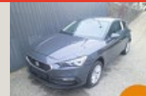
SEAT Leon Style Edition 1.5 TSI EZ 02/2025, 201 km, 115 PS/85 KW, Digitales Cockpit 8" Basic, SEAT CONNECT 3.0, E-Call statt EUR 24.590,- nur EUR 23.375,-*