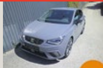
SEAT Ibiza FR Limited Edition EZ 07/2024, 5000 km, 95 PS/70 KW, 5 Jahre / 100.000 km Garantie, „SEAT TopCard“ - 12 Mo. statt EUR 27.906,- nur EUR 23.735,-*