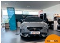
CUPRA Formentor TRIBE 1.5 TSI 150 EZ 03/2024, 201 km, 150 PS/110 KW, „CUPRA TopCard“ - 12 Monate gültig, Anhängervorrichtung schwenkbar, 5 Jahre statt EUR 43.937,-