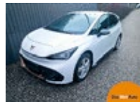
CUPRA Born 58 150kW/204PS EZ 03/2022, 53400 km, 95 PS/70 KW, 5 Jahre / 100.000 km Garantie, 11kW AC-Ladepazität, 120kW DC- statt EUR 43.700,-