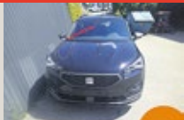
SEAT Tarraco FR 2.0 TDI DSG EZ 06/2024, 2500 km, 150 PS/110 KW, „SEAT TopCard“ - 12 Monate gültig, „AHV schwenkbar“, statt EUR 52.459,- nur EUR 44.350,-*