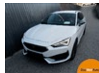
CUPRA Leon SP Kombi VZ eHYBRID EZ 05/2024, 9000 km, 150 PS/110 KW, Ladekabel für Wallbox, Anhängervorrichtung schwenkbar, Assistenz-Paket statt EUR 55.989,-