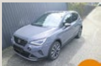
SEAT Arona FR Limited Edition EZ 01/2025, 201 km, 115 PS/85 KW, „SEAT TopCard“, 5 Jahre/100.000 km Gar., AHV Vorb. statt EUR 31.476,- nur EUR 28.975,-*