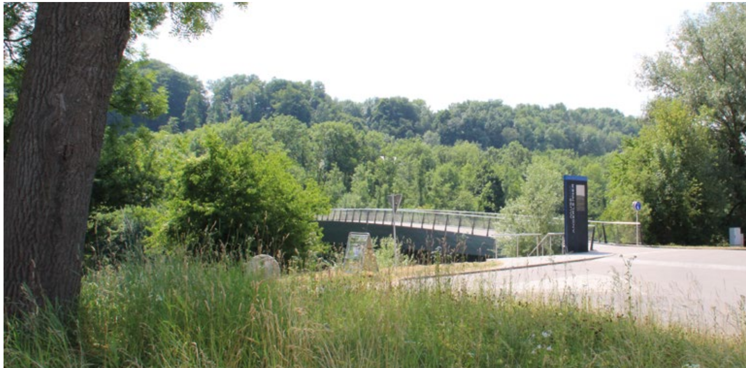
Der „Angerlehner-Steg“ mit Blickrichtung Thalheim samt Ankünder-Stele für das private Museum für zeitgenössische Kunst.