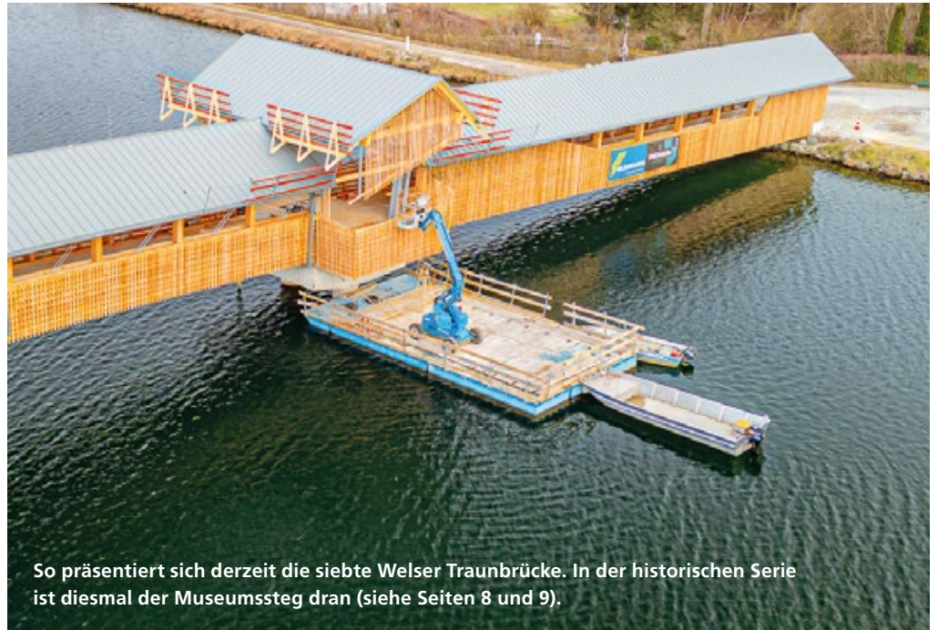
So präsentiert sich derzeit die siebte Welscher Traunbrücke. In der historischen Serie ist diesmal der Museumssteg dran (siehe Seiten 8 und 9).

Bis zur Eröffnung laufen die Fertigstellungs- und Komplettierungsarbeiten auf Hochtouren. So werden derzeit und in den kommenden Wochen unter anderem die Portalfassade, der Taubenschutz und die Übergänge bei den Mittelplattformen hergestellt. Bei den elektrotechnischen Arbeiten stehen unter anderem das Einziehen der Kabel für die spätere PV-Anlage sowie das Herstellen und Montieren der Straßen- und Geländerbeleuchtung auf dem Programm. Und auch bei der Radwegrampe sind noch wichtige Arbeiten zu verrichten: Nämlich z.B. Erdarbeiten bei den Böschungen, die Tragschicht und Feinplanie, die anschließende Asphaltierung sowie die Geländer-Montage und der weitere Landschaftsbau.