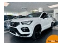
CUPRA Ateca 2.0 TSI DSG 4Drive EZ 12/2023, 13500 km, 300 PS/221 KW, Supersport-Multifunktionslenkrad, Felgen Alu 19" „CUPRA Kupfer“, statt EUR 64.863,-