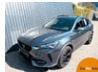
CUPRA Formentor TRIBE VZ 2.0 TSI EZ 12/2023, 17000 km, 310 PS/228 KW, „CUPRA TopCard“ - 12 Monate gültig, Fußmatten Textil Garnitur Petex, BEATS statt EUR 60.854,-