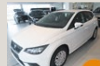
SEAT Ibiza Reference Edition EZ 01/2025, 201 km, 95 PS/70 KW, Österreich-Paket, „SEAT TopCard“ - 12 Monate gültig, statt EUR 17.739,- nur EUR 16.845,-*

*Privatkundenpreis inkl. MwSt. u. NoVA abzgl. mögl. Händlernachlässe u. ausgelobter Boni bei Finanzierung über die Porsche Bank Versicherung. Boni sind unverbindl., nicht kart. Nachlässe inkl. USt. u. NoVA u. werden vom Preis abgezogen. € 1.500, Porsche Bank Bonus für SEAT Jungwagen (max. 24 Monate) u. € 500, Versicherungsbonus bei Finanzierung eines JW (max. 120 Monate ab Erstzulassung) u. Abschluss einer KASKO über die Porsche Bank Versicherung. € 1.000, Servicebonus für JW (max. 18 Monate/15.000 km) bei Abschluss eines Service- oder Wartungsprodukts über die Porsche Bank. Aktionen gültig bis 30.06.2025 (Kaufvertrags-/Antragsdatum). Mindestlaufzeit 36 Monate. Mindest-Nettokredit 50 % vom Kaufpreis. Verbrauch: 0,4-7,1 l/100 km. Stromverbrauch: 15,6-19,3 kWh/100 km. CO 2 -Emission: 8-162 g/km. Stand 01/2025.