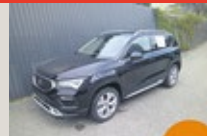
SEAT Ateca Xperience 1.5 TSI EZ 06/2024, 201 km, 150 PS/110 KW, WSS beheizbar, 5 Jahre / 100.000 km Garantie, statt EUR 41.285,- nur EUR 34.975,-*